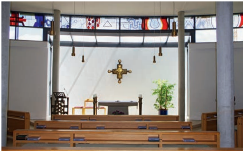
Kapelle in St. Josef

Tätigkeit, mögen die meisten Schwestern nunmehr, äußerlich gesehen, untätig sein. Doch die Werke der Barmherzigkeit beschränken sich nicht nur auf pflegerischen Einsatz. Das Wort Jesu „Was ihr für einen meiner geringsten Brüder getan habt (...)“ umfasst den Menschen in seiner gesamten Bedürftigkeit, zutiefst in seinen seelischen Nöten. Denn der Glaube, der in der Liebe tätig wird, betrifft ja nicht nur unseren Leib, sondern auch die Seele und den Geist. Und gerade da tut sich ein weites Feld der Betätigung für die Schwestern in Sankt Josef auf. Sie können für die Kranken, Leidenden, Sterbenden beten und ihnen Kraft und Trost von Gott erleben, im gläubigen Wissen, dass die letztlich tragende Brücke zum andern hin immer Gott und sein Gnadenwirken ist.