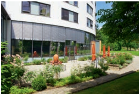
Terrasse Haus St. Josef

pflegerischen Dienst der Schwestern. Dieses Heim ist nunmehr, bayerisch ausgedrückt, das „Ausstragsstüberl“ der alten und pflegebedürftigen Schwestern, ihre Bleibe. Die jetzige äußere und innere Gestalt von Sankt Josef ist das Ergebnis mehrjähriger Umbauzeit, die dahin zum Abschluss kam, dass 2010,