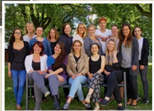
Examen Studierende Pflege Dual 2013–2016