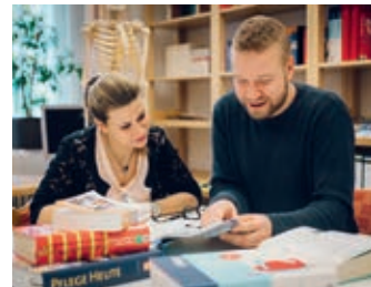
Unterrichts- und Lernsituationen