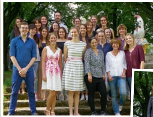
Examen Kinderkrankenpflege Kurs 2013–2016