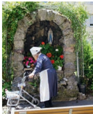
Grotte im Schwesterngarten