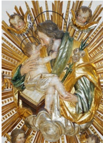
Im Tagesraum Haus St. Josef

„Schwesternheim St. Josef“ besagt somit, dass das Haus dem heiligen Josef geweiht ist. Dieser Hinweis will nicht nur der Orientierung im großen Komplex des Klinikums dienen, sondern auf die geistig-religiöse Beheimatung der Schwestern hinweisen. Die Schwestern stellen ihren Lebensabend in besonderer Weise unter das Patronat, den Schutz des heiligen Josef. Dies kam auch bei der Weihe des Hauses in dem Gebet vor der Skulptur des Heiligen Josef zum Ausdruck: