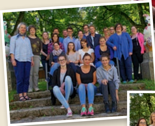
Examen Kurs A 2013–2016