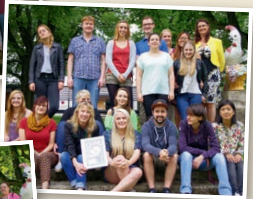
Examen Kurs B 2013–2016